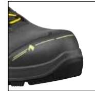
HAIX® Nano-Carbon Schutzkappe