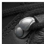
HAIX® 2-Zone Lacing