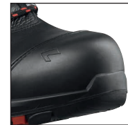
HAIX® Composite Schutzkappe