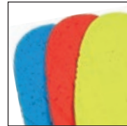
HAIX® Vario Wide Fit System