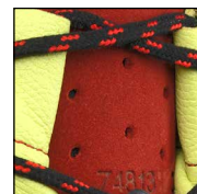
HAIX® Climate System