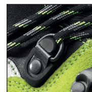
HAIX® 2-Zone Lacing