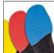
Vario Wide Fit System