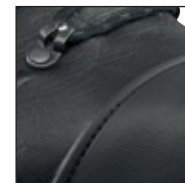
GÜK mit versenkten Nähten