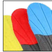
Vario Wide Fit System