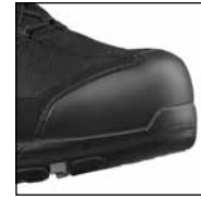
HAIX® Composite Toe Cap